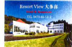
⑫ Resort View 大多喜 大多喜城下を一望できる高層に建つ、白亜のホテルと レストランのお食事、休憩、備前や飯の思い出をどうぞ。