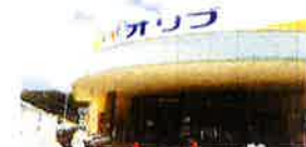
⑪ ショッピングプラザ オリブ 生鮮食品、惣菜、日用雑貨、美容、衣類、貴金属、 婦人、家族などの店舗を揃えるお店で賑わっています。