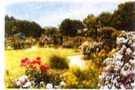
⑦ 丘の上バラ園 園内には、ホテル レストラン、カフェも充実。 バラの発根は、5月～6月、10月～11月です。