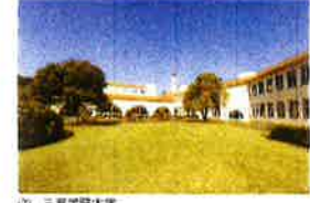
⑭ 三育学院大学 開学120年を迎える大学で、看護学部も設置され、 多くの学生が学ぶ。町との連携事業も大切にしている。