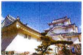
⑩ 千原麻立中央博物館 大多喜城分館 勝城の城と城下町をテーマに、中世・近世の武器、 武具、古文書などの資料が展示されています。