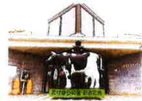
⑬ 道の駅 たけゆらの里おたき いつでも新鮮野菜や乳製品、特産品、お土産など品揃え も充実。大多喜の郷土料理が味わえるコーナーもお楽しみ。