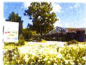
⑥ 大多喜ハーブガーデン ハーブの良やかな香りに包まれた4300㎡を 超える全天候型室内ハーブガーデン