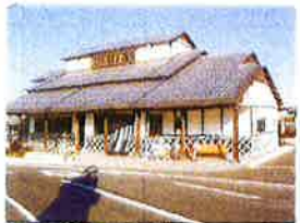
⑨ デンタルサポート 大多喜駅前 観光センター ローカルゆいすみ街道に染しゆったり系。 大多喜町の観光情報やお土産、休憩にどうぞ。